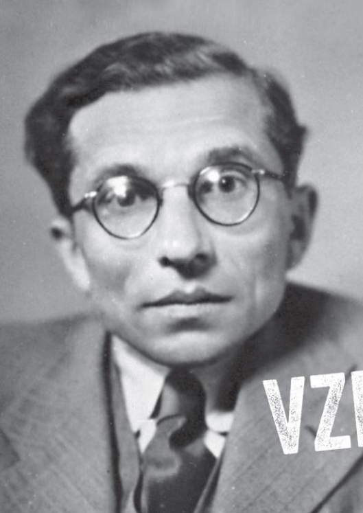
Jan Zahradníček Josef Toufar